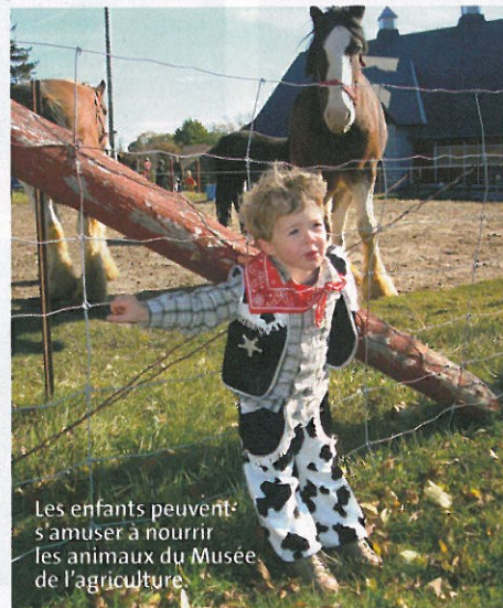
Les enfants peuvent s'amuser à nourrir les animaux du Musée de l'agriculture.