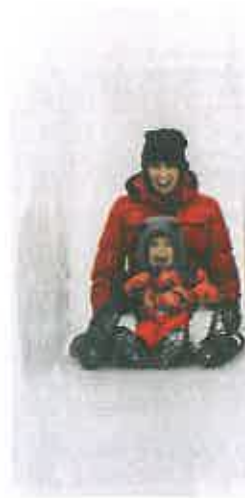
Temps fort de l'hiver, le Bal de Neige déploie un éventail d'activités et d'animations pour toute la famille.